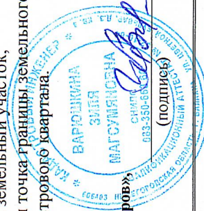
Схема выполнена ООО «Центр кадастровых инженеров» кадастровый инженер